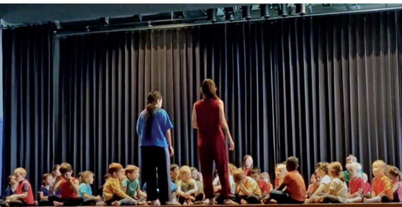
© Captures d'écran - Projet réalisé par la Cie Noem's et Cie Siamara